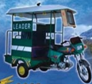
100 CC motorcycle Rickshaw