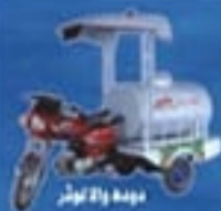
موده والا کوثر